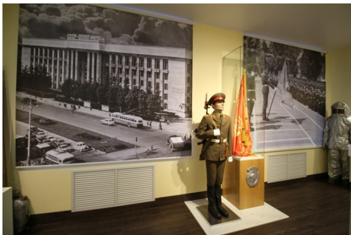
8. Экспозиция «Пожары с участием курсантов, выпускников и руководителей учебного заведения»: